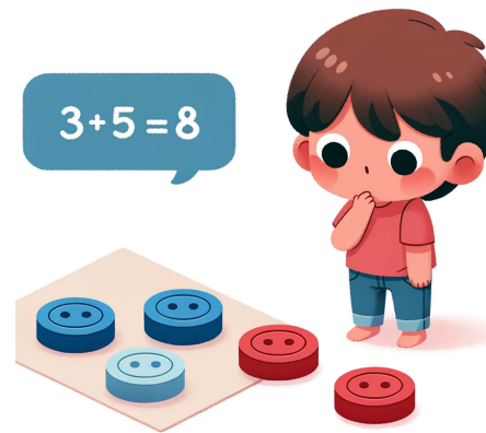
Abbildung 1. Mit DALL·E 3 unter GPT-4 erstellte Abbildung zum Prompt Rechenrahmen (links) und Plättchen (rechts)

der Grundschule generieren lassen (Abb. 1). Hierzu haben wir in ChatGPT mit der Integration von DALL·E 3 folgende Prompts eingegeben: